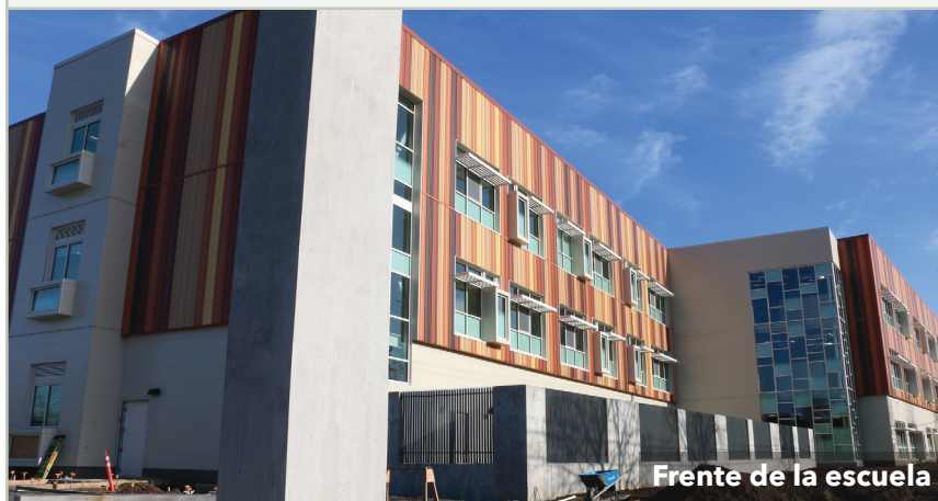
Frente de la escuela

Las instalaciones de Kellogg, diseñadas mediante un proceso exhaustivo y extenso de participación del público, cuentan con más de 100,000 pies cuadrados de nueva construcción, incluyendo un escenario de artes escénicas, un gimnasio multiuso y espacio para asambleas escolares, un área comunal grande y flexible y espacios al aire libre destinados para el aprendizaje. La escuela se convertirá en el epicentro del vecindario del sureste de Portland con su centro de recursos para la comunidad.