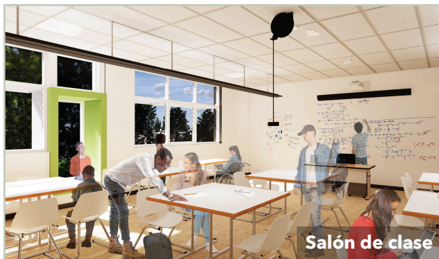
Salón de clase