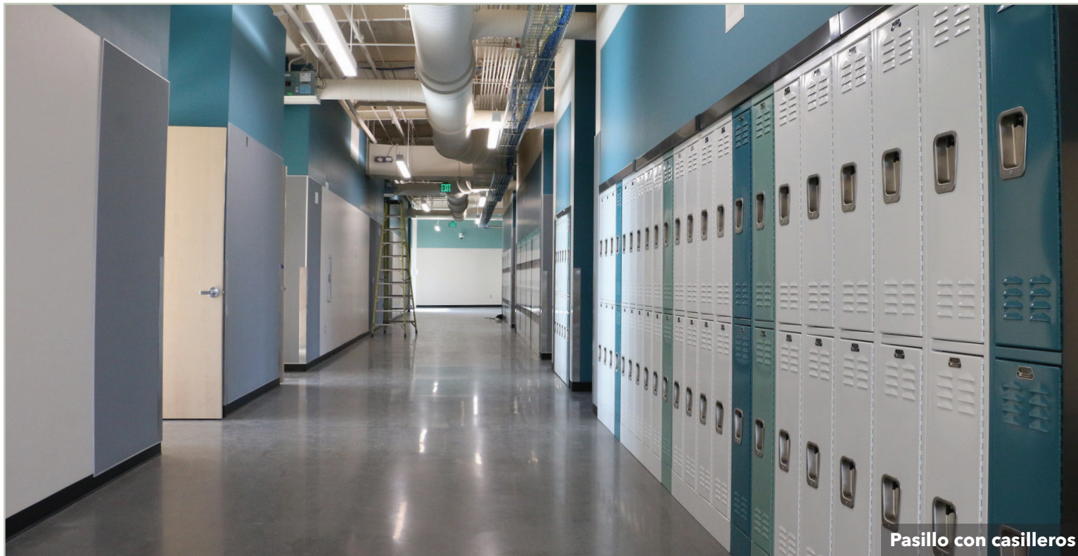
Pasillo con casilleros