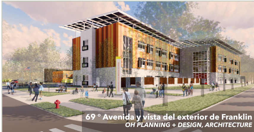
69 ° Avenida y vista del exterior de Franklin OH PLANNING + DESIGN, ARCHITECTURE